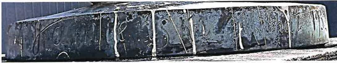
Baza statuy z sygnaturą: „WYKONAŁ Kamiński Michał 1932 r. odlew K. PACZUSKI”.

do decyzji MWKZ nr 70/2024 z dnia 04-10-2024 wpisującej do rejestru zabytków ruchomych województwa mazowieckiego pomnik dra Karola Rychlińskiego z 1932 r. (statua - odlew brąz, cokół - piaskowiec kielecki), zlokalizowany w Ząbkach, na terenie działki ew. nr 1 obr. 01-12 Ząbki, gm. loco, pow. wołomiński.