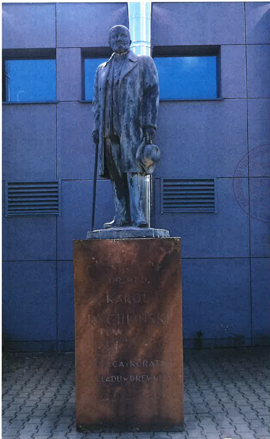
Pomnik dra Karola Rychlińskiego z 1932 r. z postumentem

do decyzji MWKZ nr 70 /2024 z dnia 04 -10- 2024 wpisującej do rejestru zabytków ruchomych województwa mazowieckiego pomnik dra Karola Rychlińskiego z 1932 r. (statua - odlew brąz, cokół - piaskowiec kielecki), zlokalizowany w Ząbkach, na terenie działki ew. nr 1 obr. 01-12 Ząbki, gm. loco, pow. wołomiński.