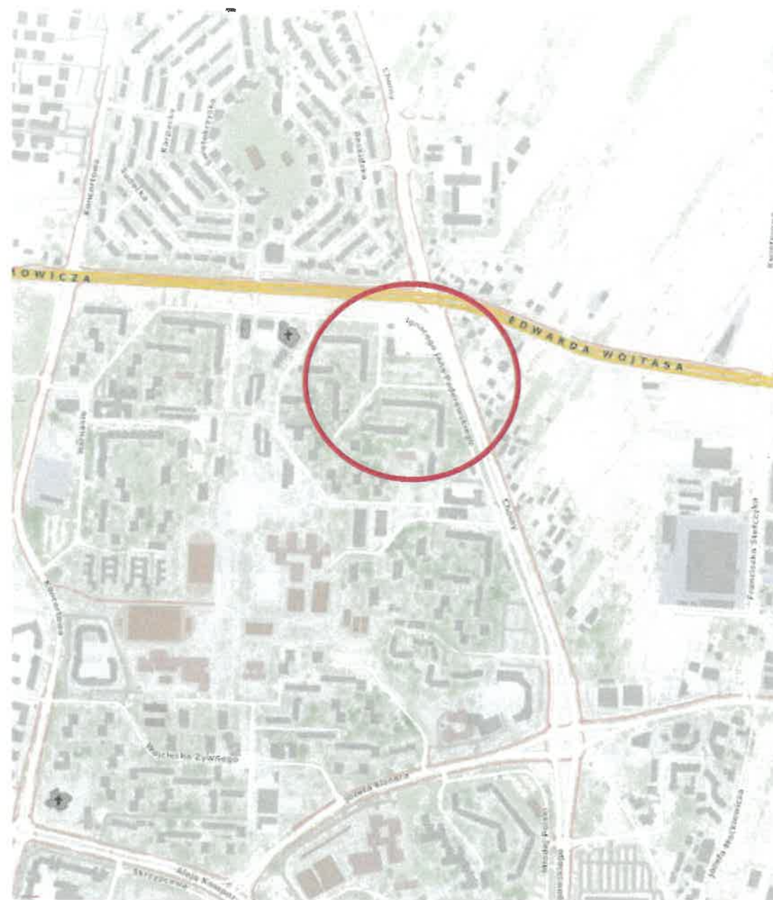
(Rys. nr 1)