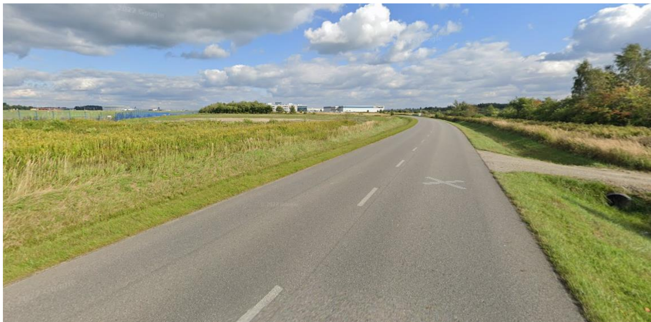
Rysunek 2. Zdjęcie poglądowe części infrastruktury drogowej strefy S1-3 objętej przedmiotem zamówienia.