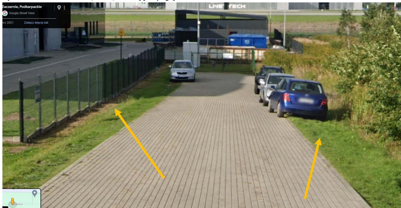
Rysunek 6 Obszar działek 1/39 i 1/37 – zdjęcie poglądowe.