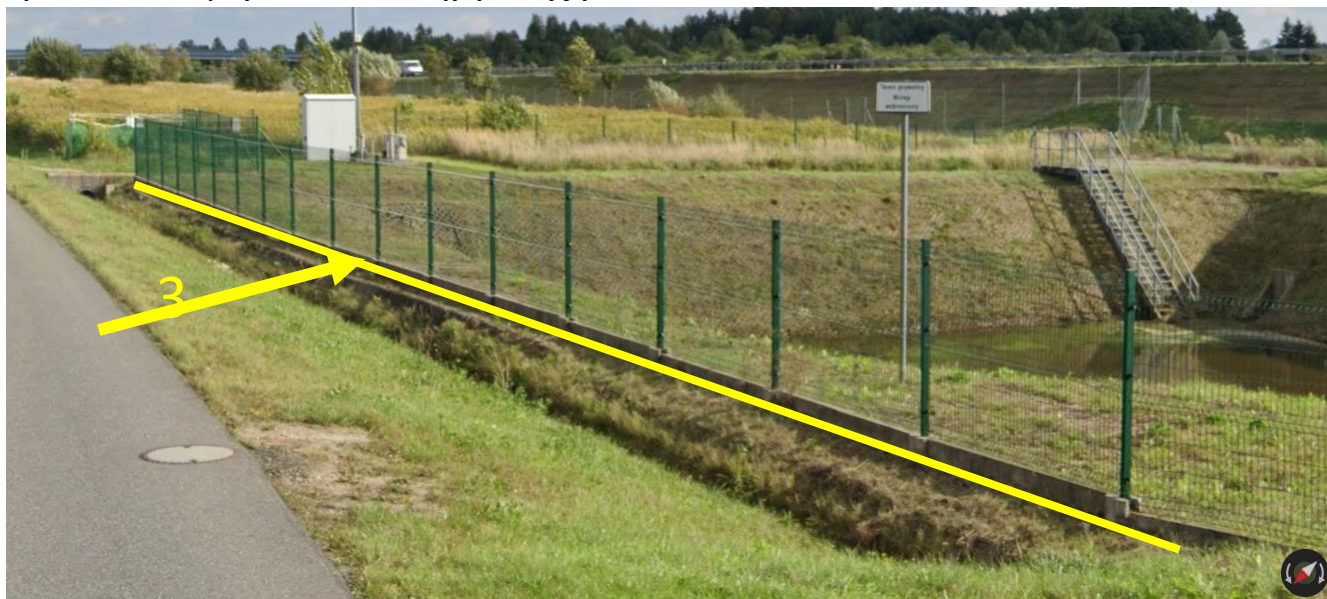
Rysunek 4 Obszar przy zbiorniku retencyjnym, objęty zamówieniem.